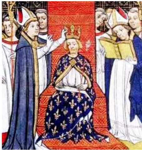
Sacre de Philippe III.

Philippe III (1245, 1270-1285) succède à son père, sous les murs de Tunis.