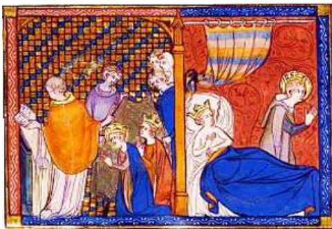
Marguerite de Provence et Louis IX.

Le règne de Louis IX s'achève en 1270. Son épouse Marguerite de Provence, qui lui avait donné onze enfants, lui survit 25 ans, retirée.