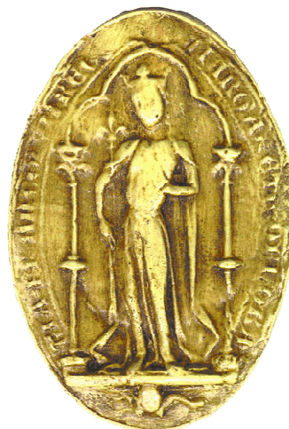
Sceau de Marguerite de Provence.

A sa mort, Edouard III d'Angleterre demanda que tous prient pour cette « reine-mère de la France ». Saint-Louis sera canonisé dès 1297.