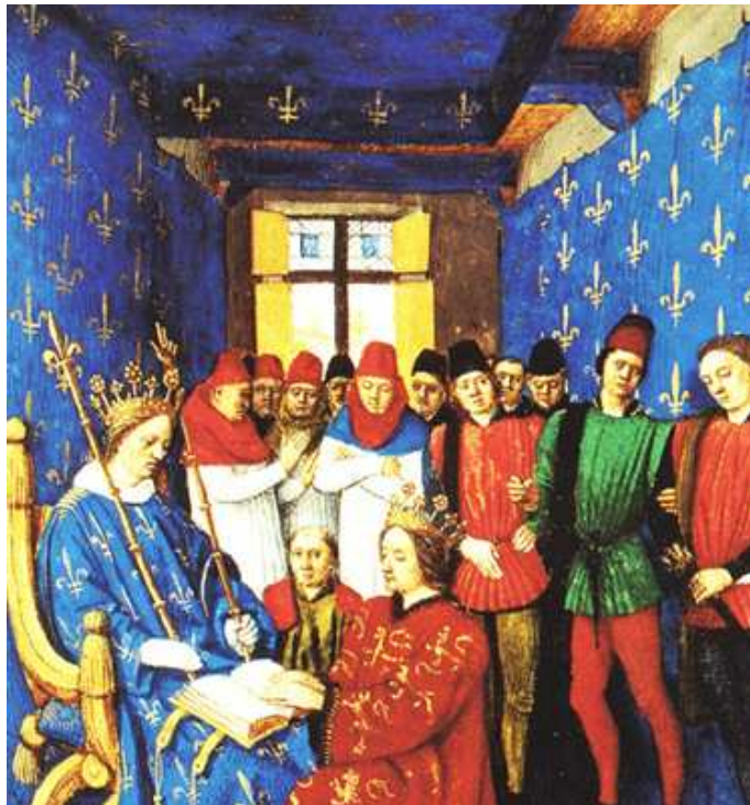
Edouard rendant hommage au roi Philippe IV dit Philippe le Bel.