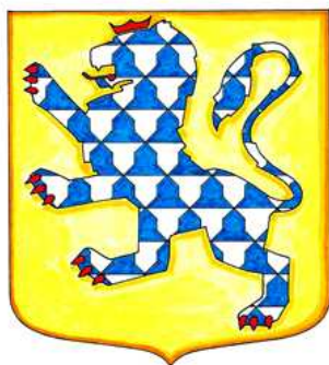
Armes de la maison de Montlaur.

La famille de Peyre est originaire de Saint-Sauveur de Peyre, dans le Gévaudan, où elle a son château. La maison de Montlaur est Languedocienne, Cévenole.