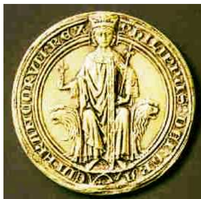
Sceau de Philippe le Bel.

On notera au passage la façon dont la tenture de droite est accrochée au mur, servant de décor et participant à isoler de l'humidité et du froid. Il existait parfois deux ou trois hauteurs de portants pour régler le « degré d'isolation ». Attention, l'illustration est postérieure à l'événement : les costumes sont à la mode de l'illustrateur et non à celle de la charnière fin XIIIe - début XIVE s.