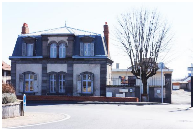
La maison de l'AMTA.