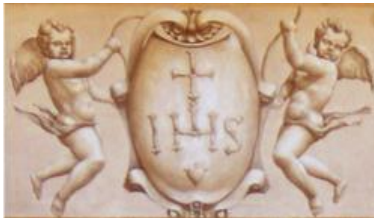
Sceau jésuite accompagné des armes de Benoît XVI et d'un cardinal sur le fronton de l'Église Saint-Ignace-de-Loyola de Rome

Le christogramme peut ainsi apparaître selon ces formes : IHS , IHC , JHS ou JHC .