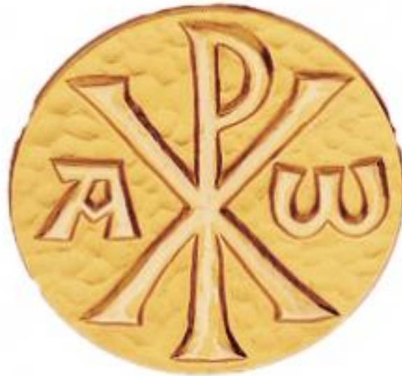
Un chrisme classique formé des lettres grecques X et P, avec alpha et oméga.

Saint-Bernardin de Sienne (1380-1444) de la famille siennoise des Albizzeschi, grand orateur qui s'était consacré aux malades pendant la peste de Sienne en 1400, était représenté tenant un IHS au centre d'un soleil. Il contribua à faire entrer ce symbole chez les Franciscains dont il devint vicaire général.