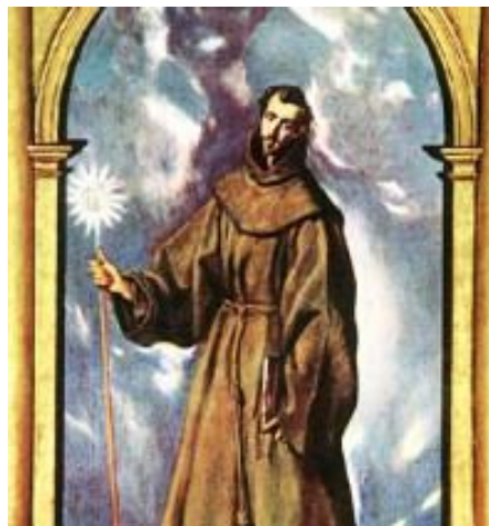
Bernardin de Sienne tenant le symbole IHS, peint par El Greco.

Saint-Bernardin de Sienne (1380-1444) de la famille siennoise des Albizzeschi, grand orateur qui s'était consacré aux malades pendant la peste de Sienne en 1400, était représenté tenant un IHS au centre d'un soleil. Il contribua à faire entrer ce symbole chez les Franciscains dont il devint vicaire général.