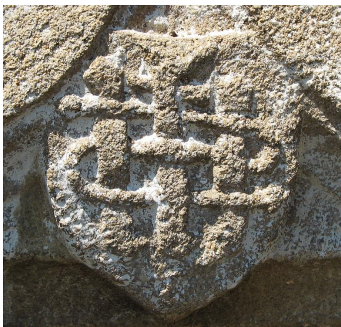
Beau IHS, compliqué, sculpté sur un linteau en accolade, rue des termes.