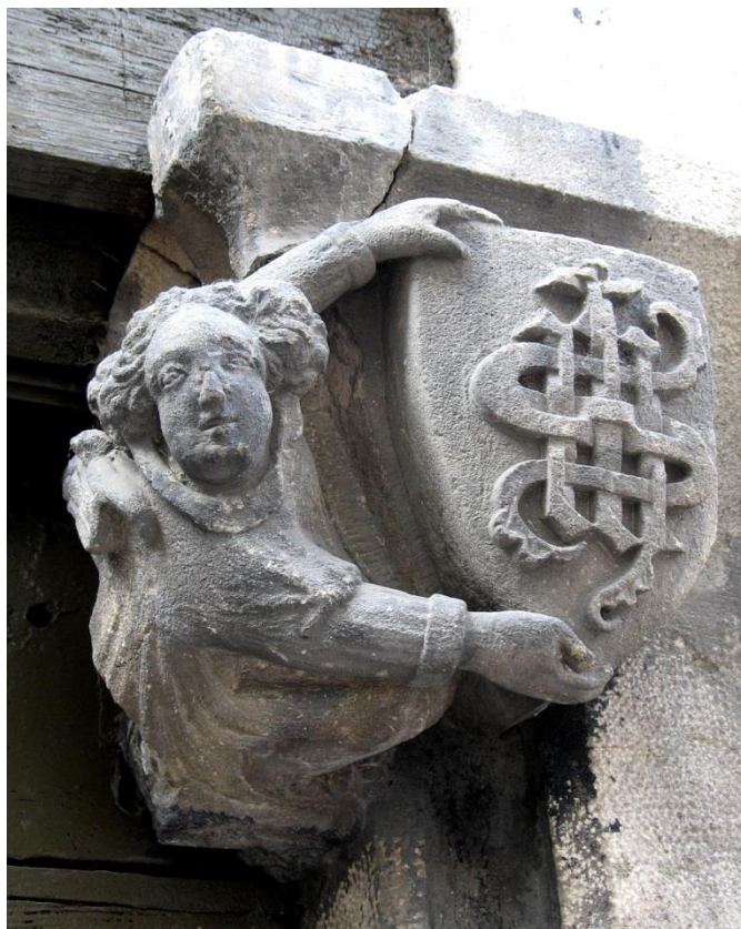
Beau IHS entrelacé au Puy en Velay.

Aucune interprétation ou explication ne nous est proposée. Nous ne pouvons pas en proposer. Cela demeure une question posée.