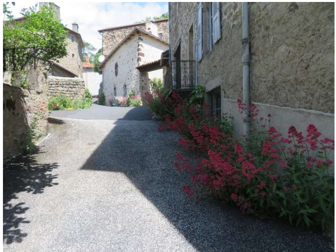
Jardinet public et Rue de la Cure.

Encore une fois, il importe que la Mairie nous soutienne et participe car lors de l'Assemblée générale de 2023, nous avons bien souligné le dépotoir rue Saint-Esprit au bout du jardin public composé du local poubelle et de l'espace bambous où rien n'a changé... La petite Cité de Caractère n'est pas que la Potence et le Centre bourg !